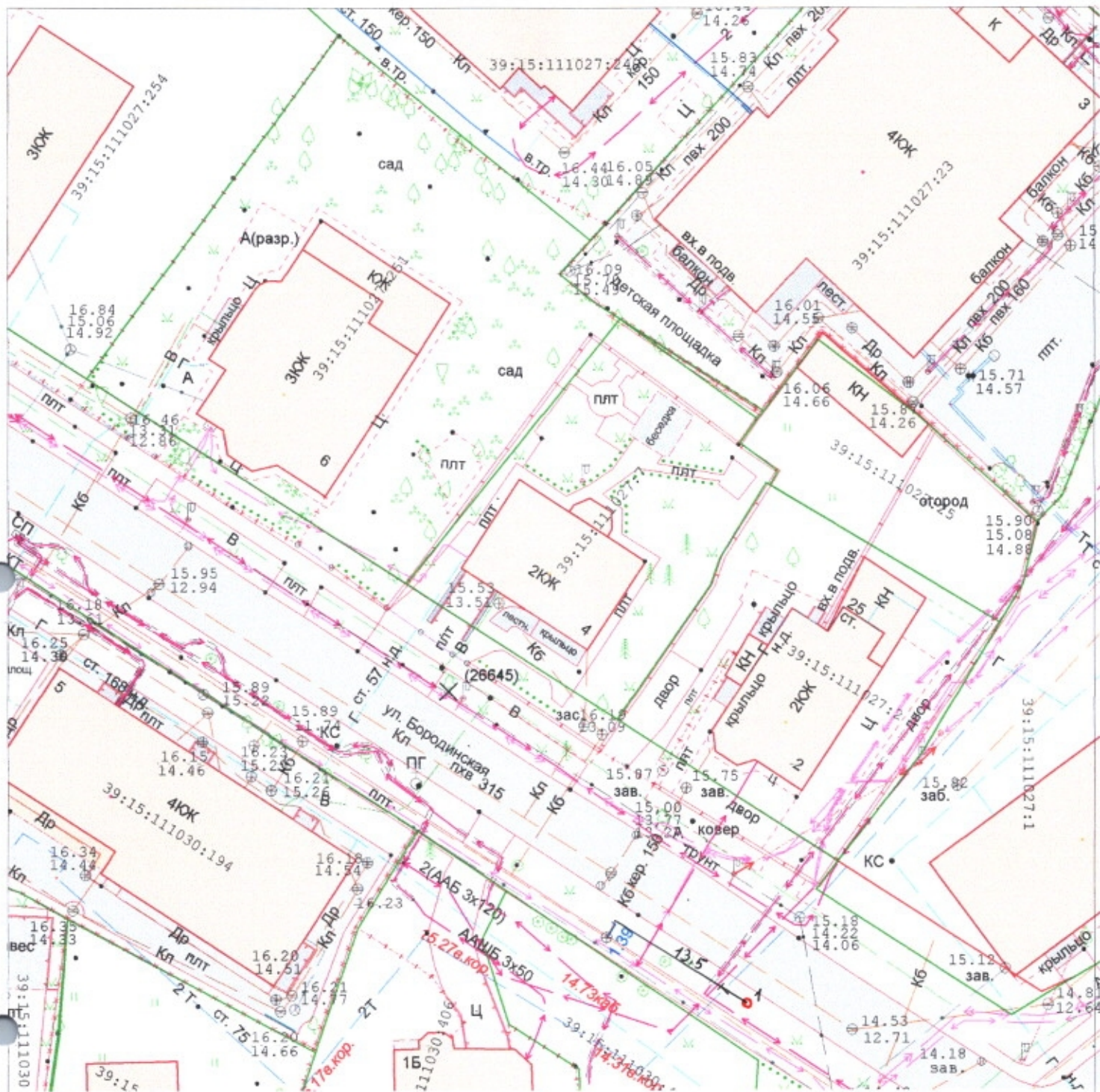
Ведомость компенсационных насаждений