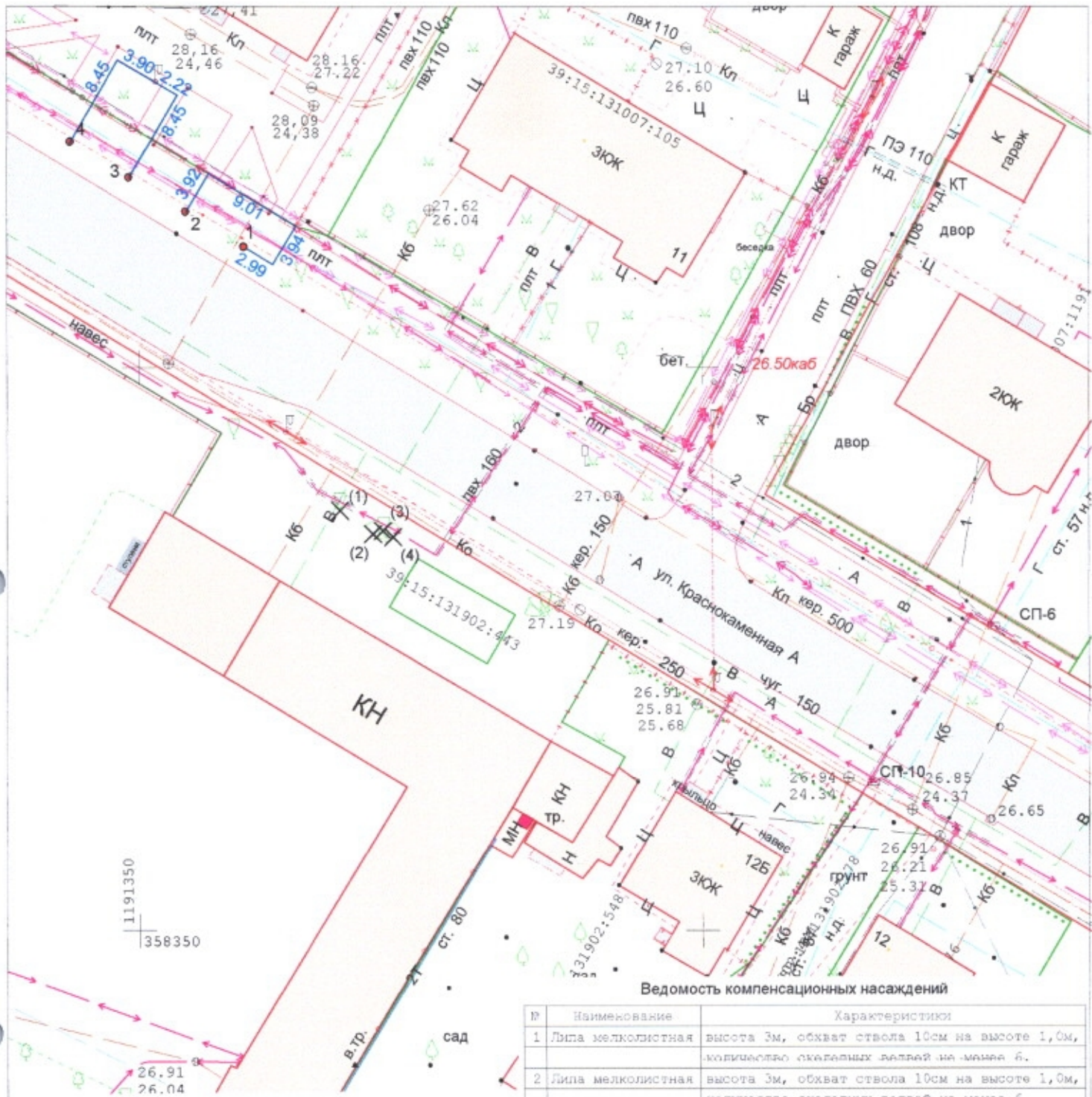
Ведомость компенсационных насаждений