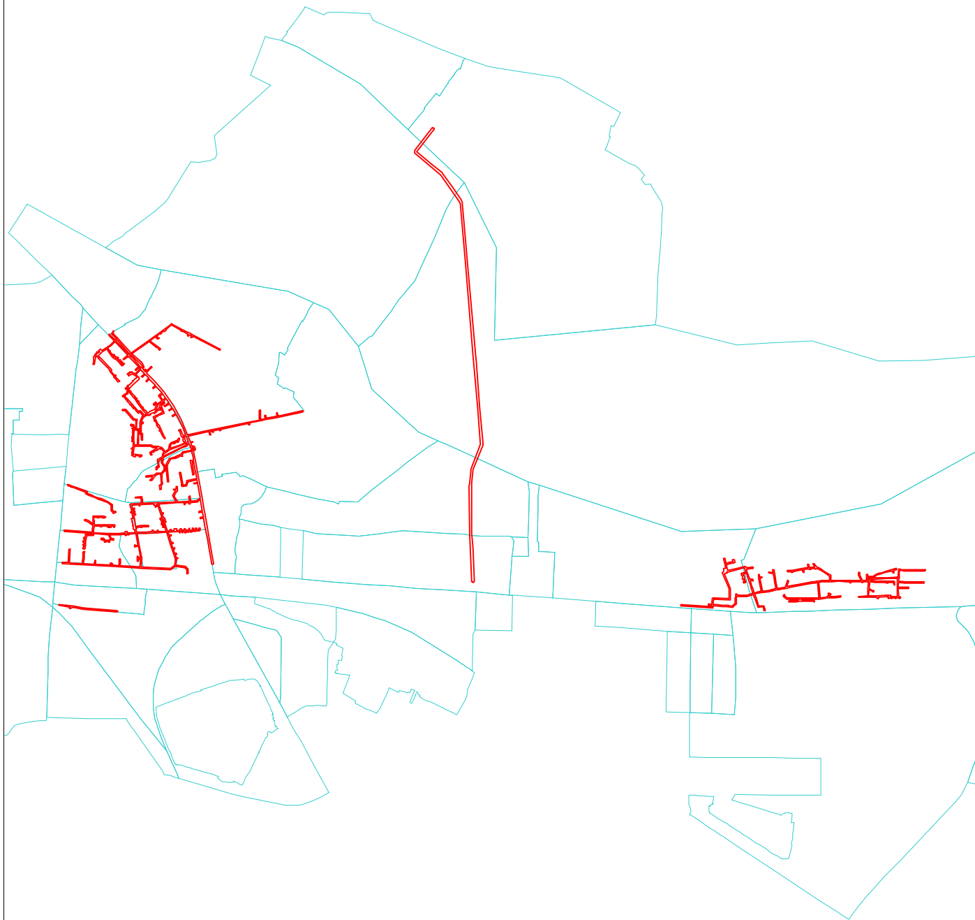
Схема расположения границ публичного сервитута Публичный сервитут для эксплуатации сетей водоотведения ( кадастровый номер объекта 39:15:000000:9801)

Используемые условные знаки и обозначения: