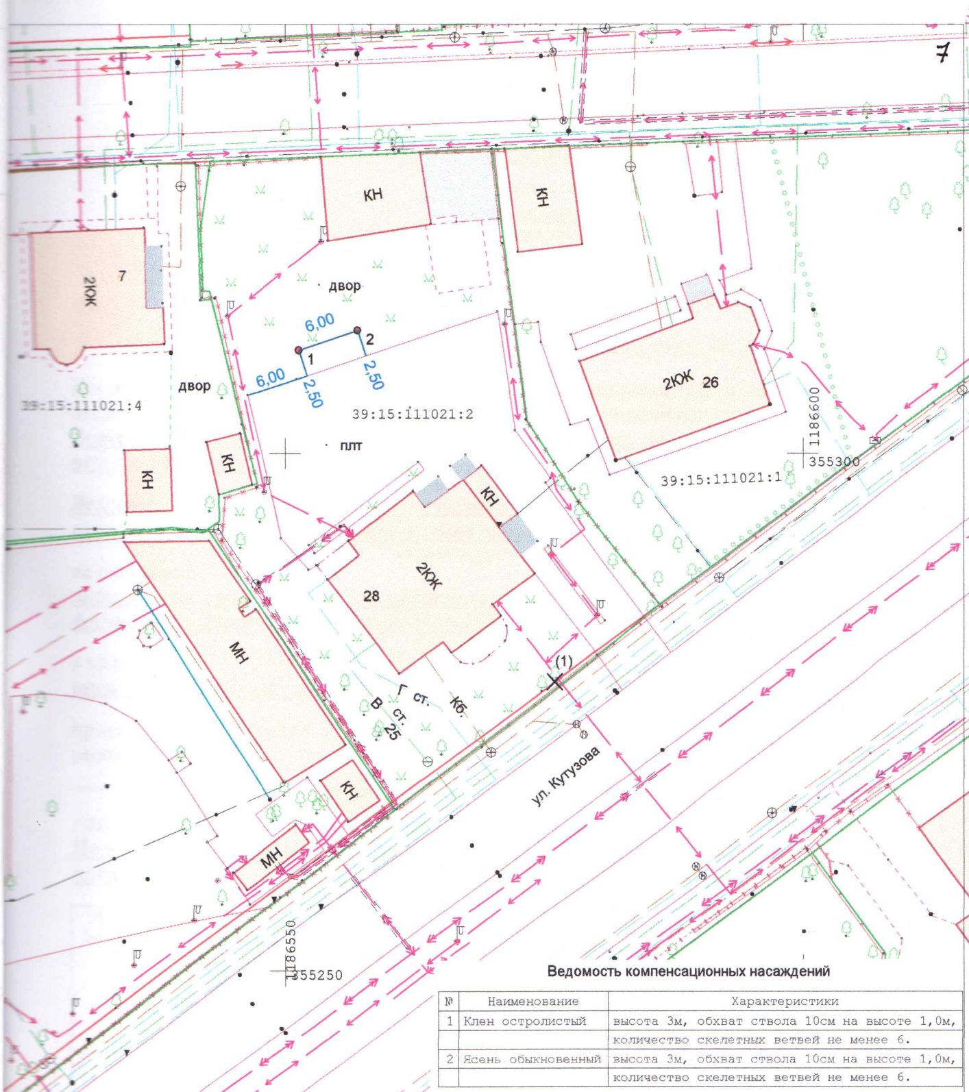
Ведомость компенсационных насаждений