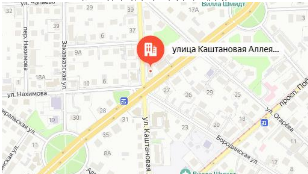
Рис. 2 Локальное местоположение Объекта оценки