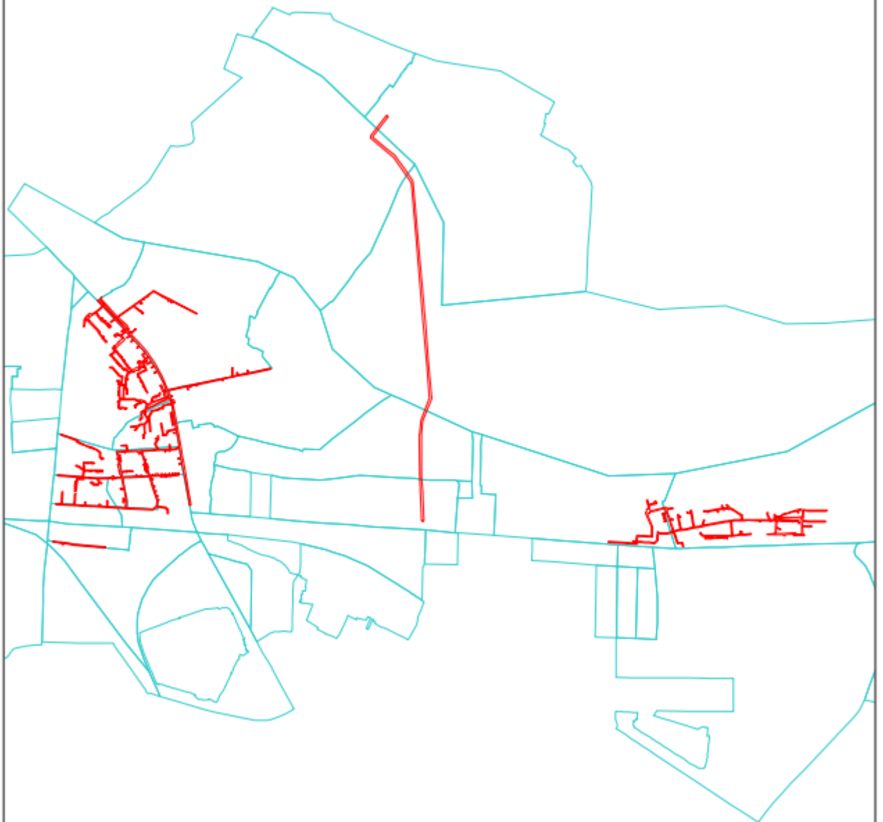
Схема расположения границ публичного сервитута Публичный сервитут для эксплуатации сетей водоотведения ( кадастровый номер объекта 39:15:000000:9801)

Используемые условные знаки и обозначения: